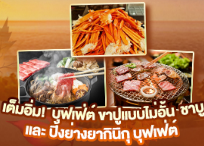
เต็มอิ่ม! บุฟเฟ่ต์ ซาปูแบบโมอิน ซาปู และ บิงยงยากินิกิ บุฟเฟ่ต์

สัมผัสความเป็นญี่ปุ่น ชมวิวฟูจิ ครบทุกไฮไลท์เด่นๆ ห้ามพลาด ตื่นตาตื่นใจกับหมู่บ้านมรดกโลกหมู่บ้านชิราคาวาโกะ ขึ้นกระเช้าลอยฟ้าชินโงทากะ ปั่นเซมเบ้เมืองทวอง นารา ขอฟรุตโตโดจิ เชคอินปราสาทโอซาก้า วัดคิโยมิสุเดระ ถ่ายรูปทำซูชิสุดฮิต ป้ายกูลิโกะ ปราสาทมัตสึโมโต้ ทะเลสาบซูวะ ขึ้นชมศาลเจ้าฟูจิซังเซเนงน หมู่บ้านน้ำใสโอชิโนะฮักโก ปิดท้ายช้อปปิ้งย่านดัง ชิบูย่า