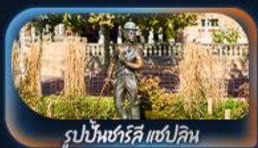
รูปปั้นชาร์ลี แชปลิน

เที่ยวครบจบทุก Highlight ตะลุยจุงเฟรา วีลิ่งการจิดเต็มสมชื่อ Top Of Europe สักครั้งในชีวิตหมู่บ้านเซอร์แมท นั่งรถไฟสาย Gornergrat bahn หมู่บ้านเลาเทอร์บรุนเนินสวยเหมือนเทพนิยาย เปิดประสบการณ์โรแมนติกล่องเรือทะเลสาบรุน ทะเลสาบเจนีวา น้ำพุจวดเจกโต ศาลาไทย รูปปั้นชาร์ลี แชปลิน The Fork ปราสาทซิลยอง หมู่บ้านอิซลทอวอลด์ สิงโตแกะสลัก สะพานไม้ชาเปล โบสถ์ฟรอมุนสเตอร์ ซ็อบป์ิงจุงเกนบนบานไอฟพตราเซอร์