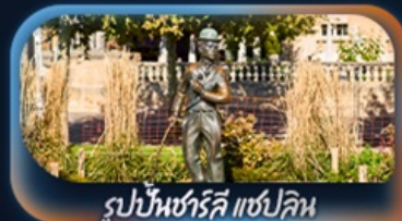
รูปปั้นชาร์ลี แชปลิน