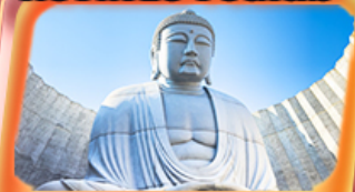
เดินพระพุทธรเจ้า