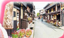
ทาคายามา