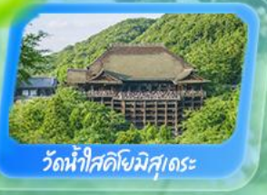
วัดน้ำใสคิโยมิสุเดระ