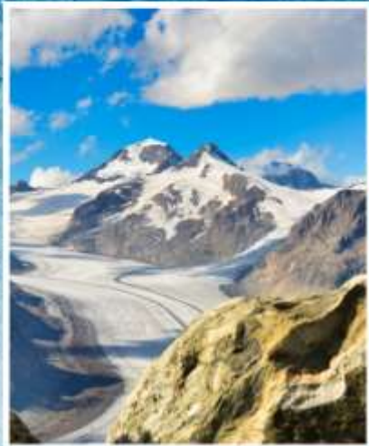
ALETCH GLACIER Riederalp, Bettmeralp

แกรนด์สวิตเซอร์แลนด์ 9 วัน พักหมู่บ้านเชอร์แมท