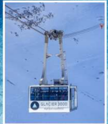
GLACIER3000 Peak walk by Tissot