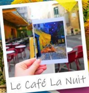
Le Café La Nuit