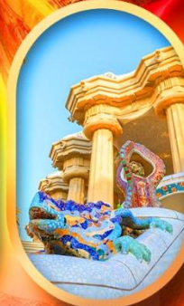
ปาร์ค กูเอล