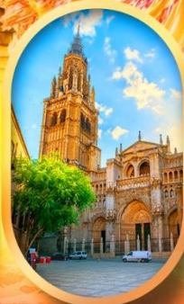
มหาวิหารโตเลโด