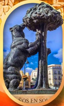
อนุสาวรีย์หมี