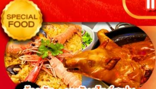
ข้าวมัน+หมูหันสไตล์สเปน