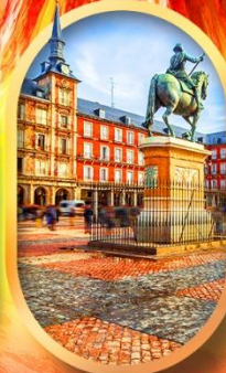
พลาซามายอร์