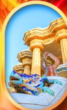
ปาร์ค กูเอล