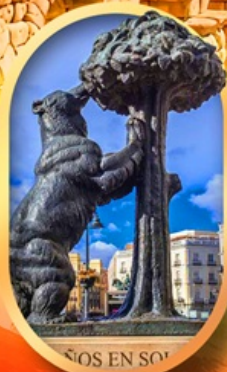
อนุสาวรีย์หมี