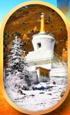
อุทยานสี่ครุณี