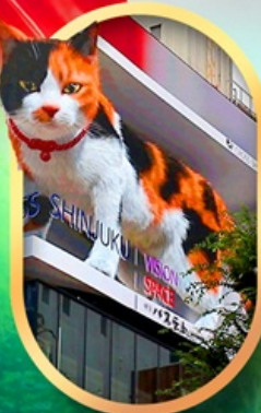
ช้อปปิ้งชินจุกุ