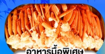
อาหารมือพิเศษ บุฟเฟ่ต์งาปู