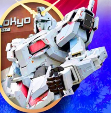
ห้างไอโดะบะกันดัม