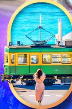
ถนนโคมาจิโดริ