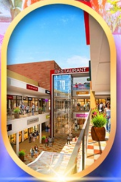
มิตซึเอะอิเกะอิเล็ค