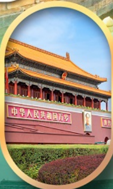
จัสมตรีสเทียนอันเหมิน