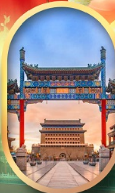
ถนนคนเดินเทียนเหมิน