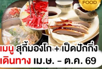
เมนูสุกั่มองโก + เปิดปักกิ่ง เดินทาง เม.ษ. - ต.ค. 69