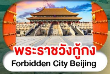
พระราชวังต้องห้าม Forbidden City Beijing