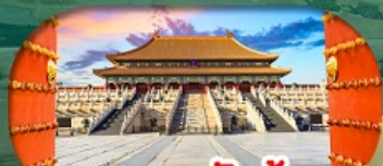
พระราชวังกู้กง Forbidden City Beijing