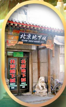
เมืองโบราณใต้ดิน