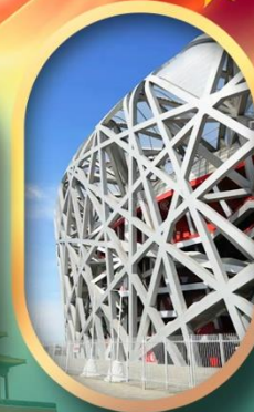
ผ่านชมสนามกีฬาฟาริงก