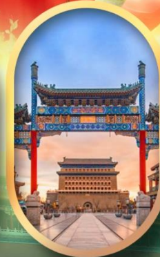
ถนนคนเดินเทียนเหมิน