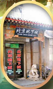
เมืองโบราณใต้ดิน