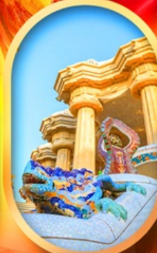
ปาร์ค กูเอล