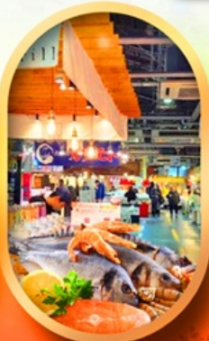
ตลาดปลาฮิโงะ