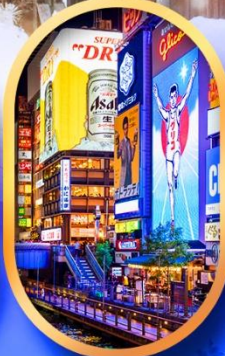
ย่านชินโซบาชิ