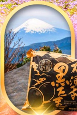
หุบเขาไอวาคุดานิ