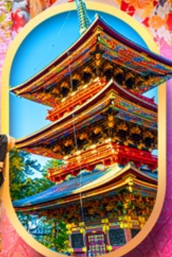
วัดนาริตะซัน