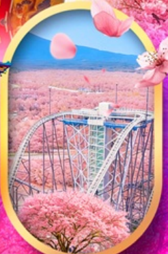
ฟูจิยาม่า ทาวเวอร์