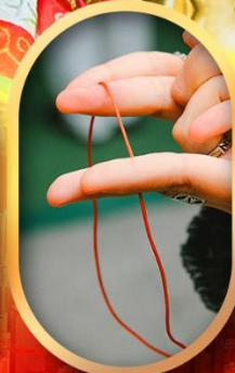
เสริมดวงความรัก