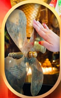
หมอนกั้งหันแซง