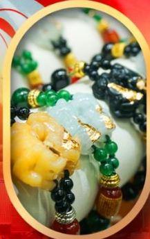
ร้านหยกอัญมณี