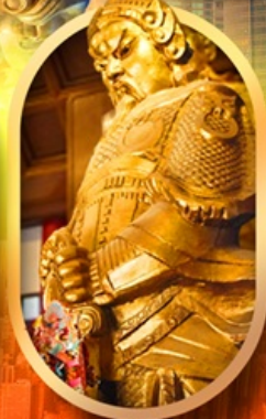
เทพวัดแชกง

เที่ยว 2 ประเทศ ท็อป วัดดัง ช้อปปิ้งจุใจ