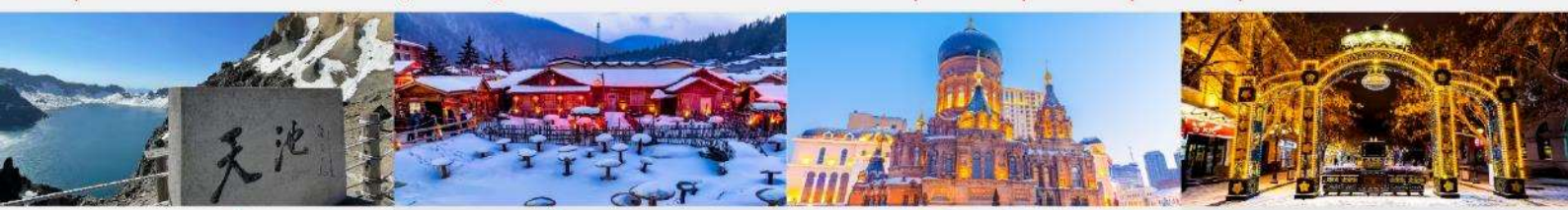
อุทยานฉางไป่ซาน