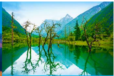
หุบเขาชวงเจียวโกว