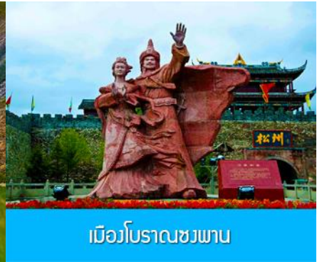
เมืองโบราณชวงพาน