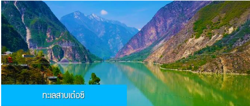
ทะเลสาบเต๋อซี

พักที่ MINJIANG HOTEL 5* หรือ โรงแรมระดับ 5 ดาวท้องถิ่น