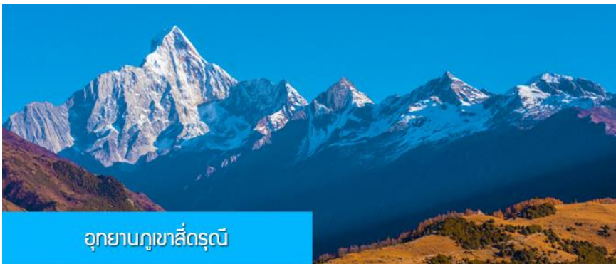
อุทยานภูเขาสี่ครุณี

หลังอาหารนำท่านเที่ยวชม หุบเขาชวงเจียวโกว 双桥沟景区 ที่เป็นแหล่งท่องเที่ยวที่สวยงามที่สุดแห่งหนึ่งในเขตอุทยานภูเขาสี่ครุณี นำท่านนั่งรถบัสของอุทยานที่วิ่งไปผ่านเส้นทางที่สร้างคู่ขนานกับลำธารกษยในหุบเขา ท่านจะได้สัมผัสกับความสวยงามของทัศนียภาพธรรมชาติที่หาชมได้ยาก โดยมีภูเขาหิมะสูงตระหง่านอยู่เบื้องหลัง ธารน้ำใสไหลริน และสระน้ำที่มีสีเขียวมรกต ในฤดูใบไม้ผลิและฤดูร้อนท่านจะได้เห็นฝูงจามรีท่ามกลางทุ่งหญ้าเขียวจี ส่วนในฤดูหนาวทุ่งหญ้าและพื้นดินจะปกคลุมด้วยพรมหิมะสีขาว...รถบัสของอุทยานจะนำนักท่องเที่ยวไปยังจุดชมวิวสำคัญต่าง ๆ ภายในเขตอุทยาน เพื่อให้ท่านท่องเที่ยวได้เที่ยวชมสถานที่และถ่ายรูปตามอัชฌาศัย จนครบแ่เวลา นำคณะขึ้นรถบัสออกจากอุทยาน