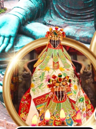
เยี่ยมเงินเจ้าแม่กวนอิมสองห้า