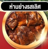
हांอย่างรสเลิศ