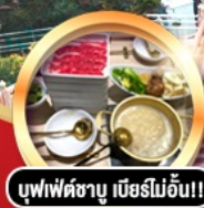
บุฟเฟ่ต์ชาบู เมื่อบริไม้อัน!!