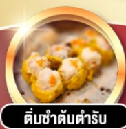
ติ่มซำต้นตำรับ

การ์ตูนดี!! พักหรู 4 ดาว PRUDENTIAL HOTEL ติดถนนนาธาน ย่านช้อปปิ้งจิมซาจู้