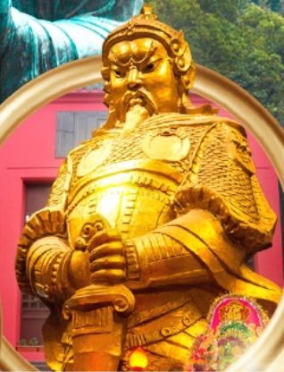
วัดแชกงหมิว