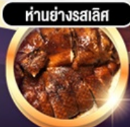
ห่านย่างสไลซ์