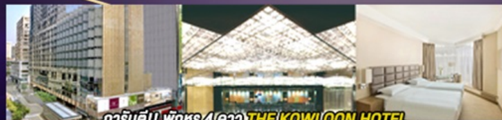
гаринди!! พักหรู 4 ดาว THE KOWLOON HOTEL ติดถนนนาราน ย่านช้อปปิ้งจิมซาจุ่ย