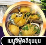
เมนูซีฟู้ดลิ้มมุน