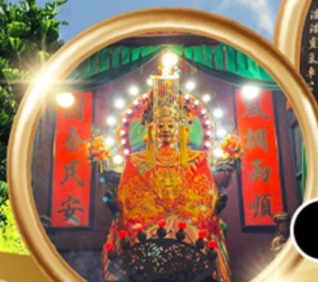
ขอพรซื้อขายอสังหาริมทรัพย์