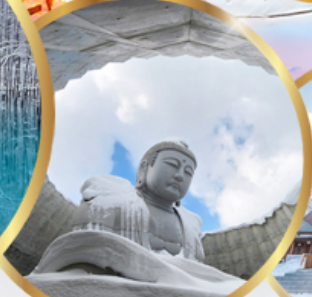
เป็นเขาแห่งพระพุทธรเจ้า