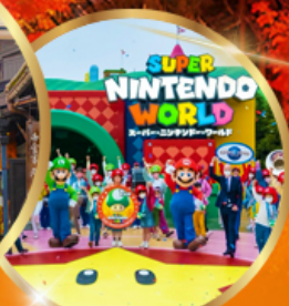
อิสระ UNIVERSAL STUDIO