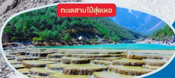
ทะเลสาบไ้ส่วยเหอ