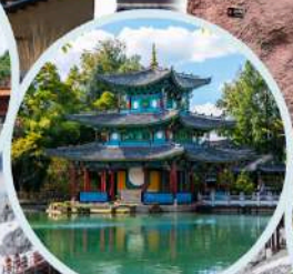
สระมังกรคำ