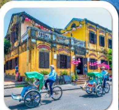
"เมืองโบราณฮอยอัน"