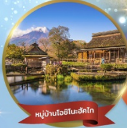
หมู่บ้านโอชิโนะซึกิโก