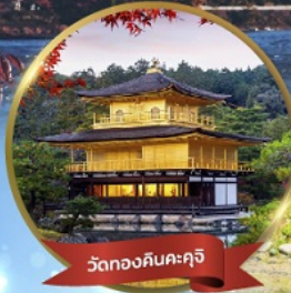
วัดทองคินคะคุจิ