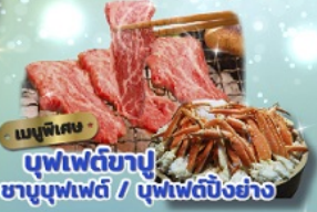
เมนูพิเศษ บุฟเฟ่ต์ย่าง ซาซิมิบุฟเฟ่ต์ / บุฟเฟ่ต์บิงย่าง

วันเดินทาง 18-24 พ.ย.2567 1-7 ธ.ค.2567 6-12 ธ.ค.2567