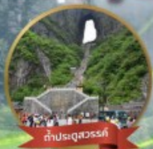
กำแพงสวรรค์