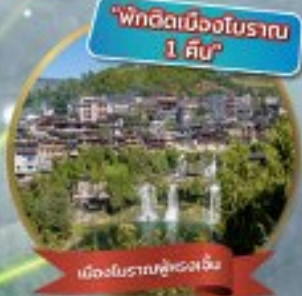
"พักติดเมืองโบราณ 1 คืน"