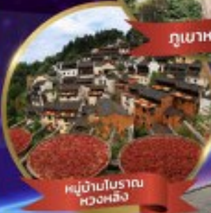
หมู่บ้านโบราณหวงหลิง