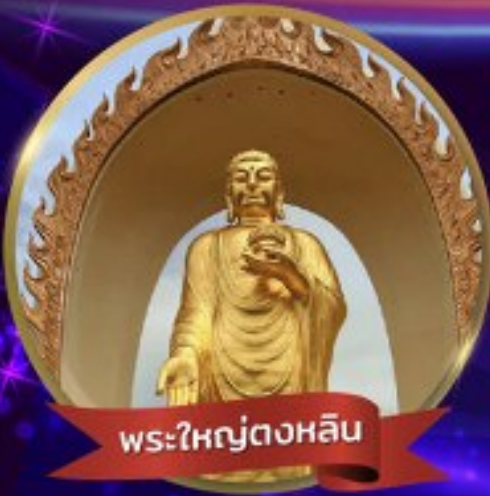
พระใหญ่ตงหลิน