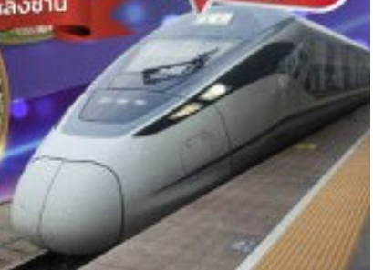
"รถรถไฟความเร็วสูงเส้าชางฮง"