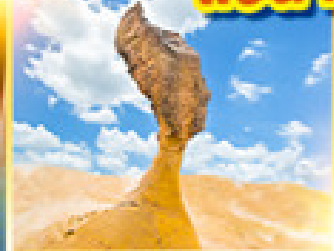
อุทยานเหย่หลิว

เที่ยวเต็ม!! ไม่มีวันอิสระ แช่น้ำแร่ในห้องพักส่วนตัว