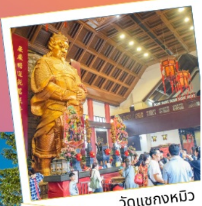
วัดเขangkงหมิว