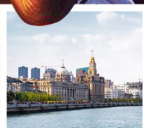
หาดว่อกาน