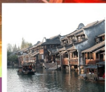
เมืองโบราณผานหลงกู่จิน