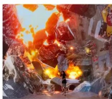
SPACE &amp; TIME CUBE