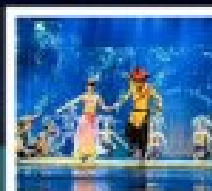
โชว์สีสันสุดปัง