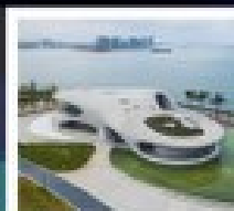
ห้างสรรพสินค้า