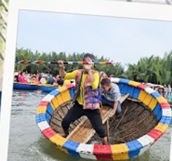
เรือกระด้ง

เพิ่มเวลาเที่ยวบนบ้าน่าฮิลล์ บ้านกว่าเดิม ทานบุฟเฟ่ต์ บนบ้าน่าฮิลล์ 2 มื้อ