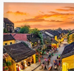
เมืองโบราณฮอยอัน