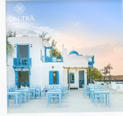
ซานตารีน่าคาเฟ่