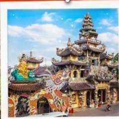
วัดมังกร