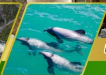
ส่องเรือชมโลมา อ่าวอาคารัว