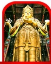
วัดกานดา