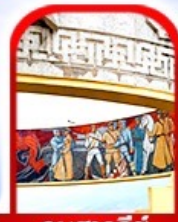
อนุสาวรีย์ โซซาน