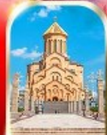
HOLY TRINITY CATHEDRAL