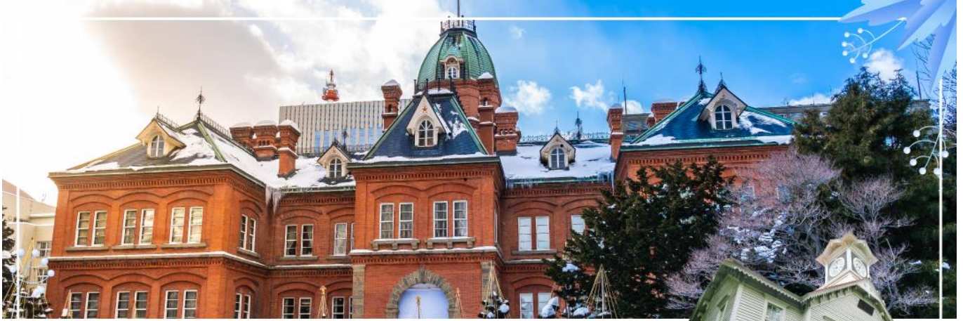
FORMER GOVERNMENT OFFICE BUILDING ที่ทำการรัฐบาลเก่าฮอกไกโด

การรัฐบาลท้องถิ่นสมัยบุกเบิกเกาะฮอกไกโด ปัจจุบันเปิดให้ประชาชนเข้าชมห้องทำงานต่างๆ และ หอสมุดเก็บบันทึกทางราชการ ผ่านชม หอนาฬิกาเมืองซัปโปโร ( Sapporo Clock Tower หรือ ภาษาญี่ปุ่นเรียกว่า Sapporo Tokeidai ) เป็นหอนาฬิกาโบราณมีลักษณะเป็นอาคารไม้ที่มีหลังคา สีแดงและผนังสีขาวถูกออกแบบและบริจาคให้โดยรัฐบาลสหรัฐอเมริกา ในปี ค.ศ. 1878 เป็น สัญลักษณ์ทางวัฒนธรรมและประวัติศาสตร์ของเมืองซัปโปโร สำหรับตัวนาฬิกาถูกติดตั้งในปี ค.ศ. 1881 จากบริษัท E. Howard & Co. เมือง Boston และในปี ค.ศ. 1970 หอนาฬิกาแห่งนี้ถูกกำหนดให้เป็นทรัพย์สินทางวัฒนธรรมที่สำคัญแห่งชาติ อีกด้วย