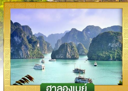
ฮาลองเบย์