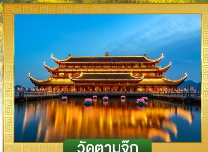
วัดตามจุก