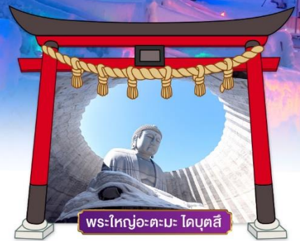
พระใหญ่อะตะมะ ไดบุตสึ