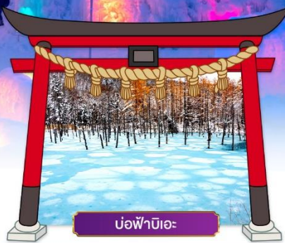
บ่อฟ้าบิเอะ