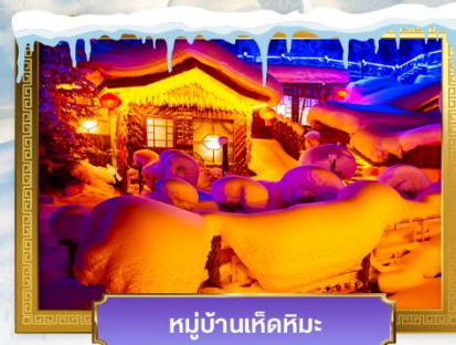
หมู่บ้านหิมะหิมะ

เดินทางโดย : สายการบินโซน่าเซาเทิร์นแอร์ไลน์