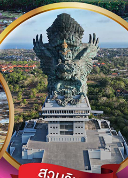
สวนวิษณุ