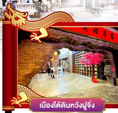
เมืองใต้ดินหวังฟูจิ่ง

อิสระ 1 วัน เลือกช้อปปิ้งในเวสต์หรือ POP LAND