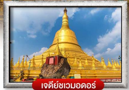
เจดีย์ชเวมอดอร์

เมนู สุดพิเศษ | กุ้งแม่น้ำเผา + บุฟเฟ่ต์นานาชาติ