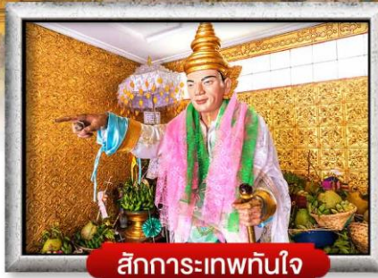
สักการะเทพทันใจ