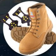
รองเท้าสำหรับเดินบนหิมะ น้ำแข็ง หรือติดก้นส้น Ice grippers