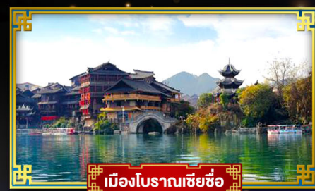
เมืองโบราณเซี่ยซือ