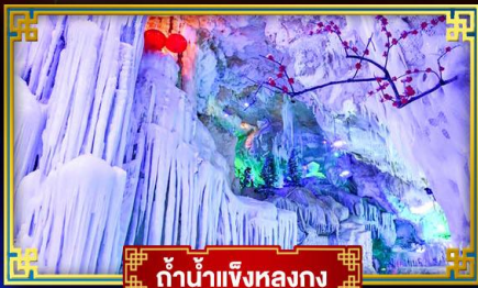
ถ้ำน้ำแข็งหลงกง

"เที่ยว 2 มณฑล กวางซี-ก๊วยโจว" สุดอลังการ น้ำตก 2 พรมแดน แหล่งท่องเที่ยวระดับ 5A