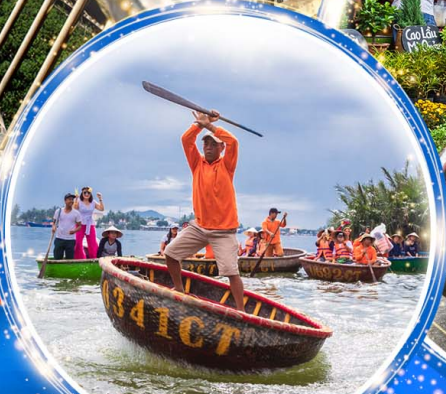
นั่งเรือกระดัง Hoi an