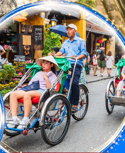
นั่งรถสามล้อซิโคล