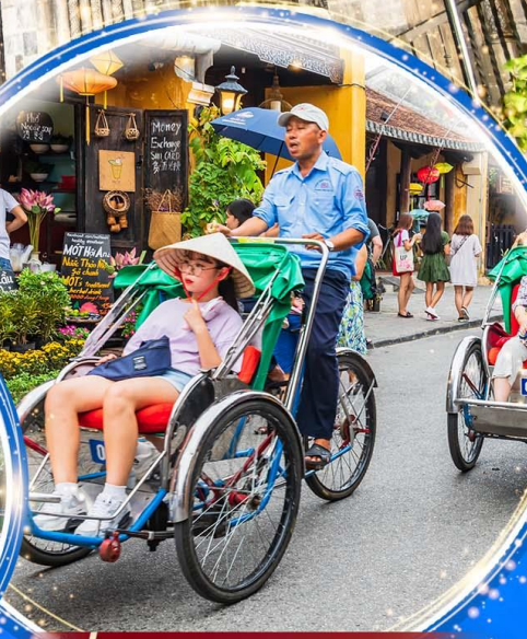
นั่งรถสามล้อซิโคล