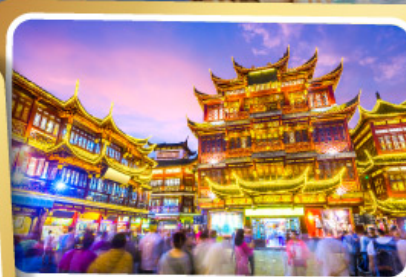
ตลาดร้อยปีเจียงหวงเมี่ยว

สนุกสนานไปกับเครื่องเล่น Shanghai Disneyland เต็มวัน